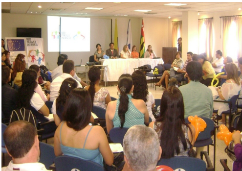
Cabildeo con candidatos Agosto 3 2011 ESAP

presaron el rechazo a situaciones como maltrato, abuso sexual, trabajo infantil, entre otros; comprometiéndose a conocer la convención de los derechos del niño, la ley de infancia y adolescencia, generar acciones de articulación con las instituciones, conocer la situación de la infancia que implica la cons-