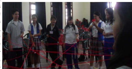
Actividad de integración "Telaraña"